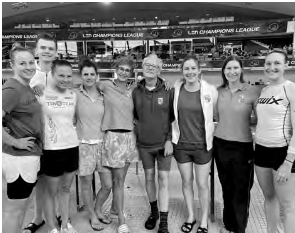
Unsere Mannschaft in Hannover

Am 25. und 26. März 2023 standen die Norddeutschen Meisterschaften im Stadionbad Hannover für die Masters auf dem Programm.