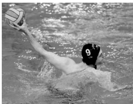
Der zehnte Sieg in Folge

Die Wasserballer des SV Poseidon Hamburg (SVP) sind nicht zu stoppen. Auch im zehnten Zweitligaspiel stieg der SVP als Sieger aus dem Wasser. Im heimischen Inselepark gewannen die Hamburger 11:6 (3:0, 4:1, 2:3, 2:2) gegen Hellas-99 Hildesheim.